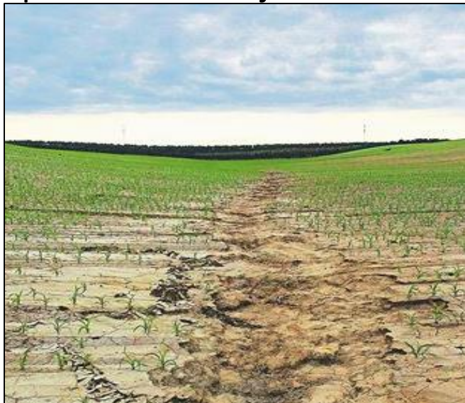
opatření zamezující vodní erozi