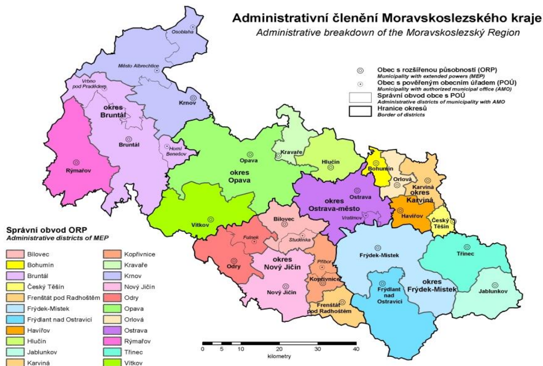
Obr. č. 1. Administrativní členění MSK